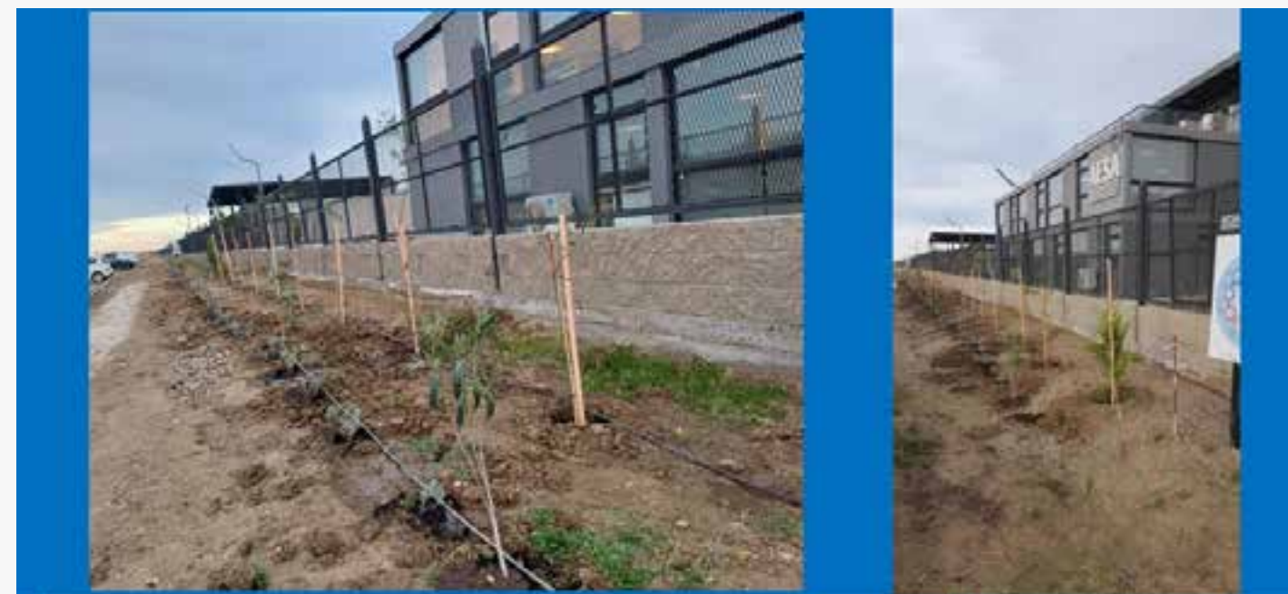
FORESTACION BASE P&WO COMODORO- 2024

Forestacion Base Centenario- 2025 (Archivo PDF)