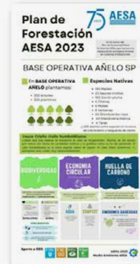
Jornada 23, 24 y 25 de Abril 2023

Forestacion Base P&Wo Comodoro-2025 (Archivo PDF)