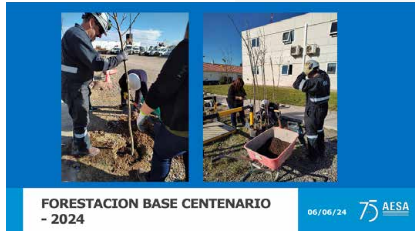
FORESTACION BASE CENTENARIO - 2024